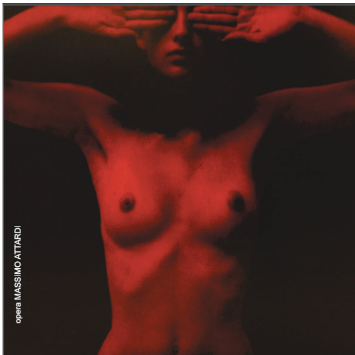
opera MASSIMO ATTARDI