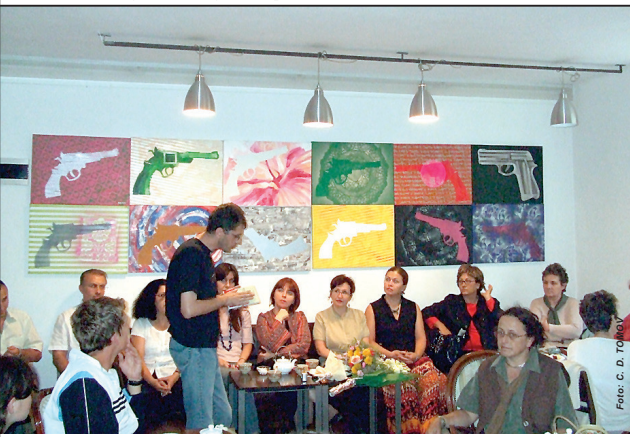
Cinci dintre autoarele cărții s-au întâlnit cu cititorii timișoreni