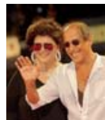
Adriano Celentano e Claudia Mori all'ultima Mostra del Cinema al Lido

Da concorrente a rischio scomparsa all'indomani del cambio al vertice in Campidoglio, a temibile corazzata che si avvicina nuovamente a Venezia. È il Festival Internazionale del Cinema di Roma che per la sua quarta edizione, nel 2009, anticiperà le date di una settimana rispetto al 2008: si terrà infatti dal 15 al 23 ottobre 2009. Come dire che la logorante guerra di date fra Venezia e Roma sta per riaccendersi dopo un momento di calma apparente. La rassegna capitolina, infatti, torna ad avvicinarsi alla Mostra del Cinema di Venezia, esattamente così com'era avvenuto nella