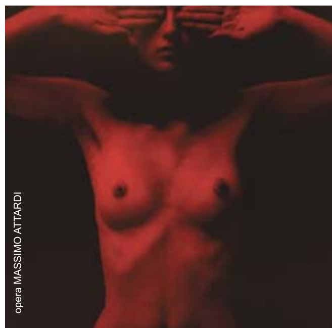
opera MASSIMO ATTARDI

55 Paesi in gara 90 Opere finaliste 3300 Opere iscritte