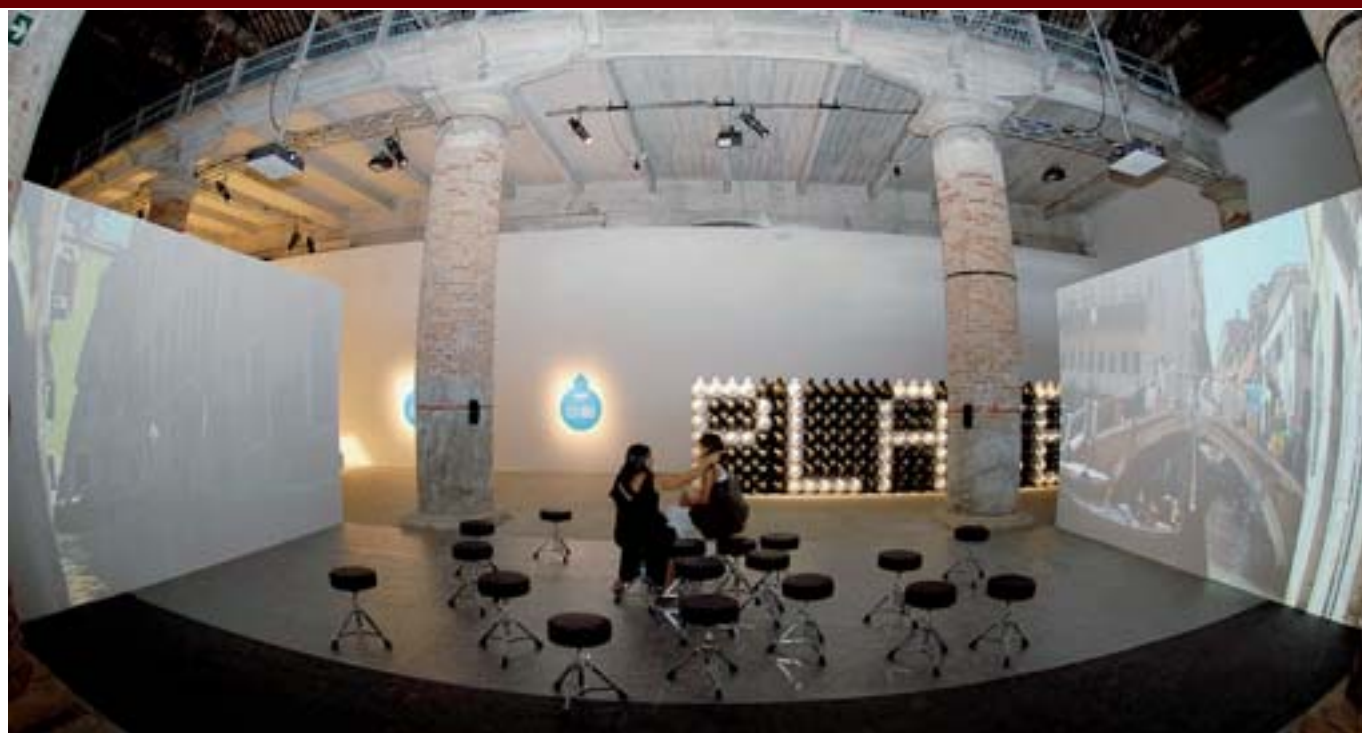
Competizione e creatività Un'installazione della Biennale di Architettura. I tagli non risolvono i problemi della cultura (Vision)

Che il sistema così com'è funzioni male a me pare indiscutibile e che in que-