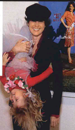
A cura di GERMANO D'ACQUISTO

«Riconosco il momento giusto per lo scatto: ti porta a pensare ad altro, che non sia solo quello che vedi». Ex modella, Tierney Gearon è una delle fotografe americane più intense della sua generazione. Soggetti prediletti? I suoi figli, protagonisti di Alphabet Book (a pag. 176 e in scena da Colette a Parigi fino al 30/11, colette.fr ).