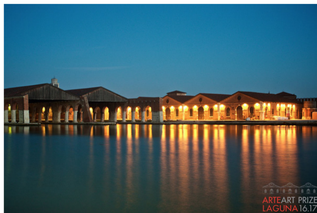
Esterno Arsenale di Venezia. Location mostra.

Sempre in linea con le tendenze artistiche contemporanee il Premio Arte Laguna apre la nuova edizione, la dodicesima, allargando le sezioni di concorso all'Arte Urbana. Salgono così a nove le categorie artistiche a cui il contest internazionale si rivolge, categorizzazioni convenzionali che sempre più si contaminano, ma che permettono di mappare lo stato dell'arte attuale: pittura, scultura e installazione, arte virtuale, arte fotografica, grafica digitale, video arte e cortometraggi, performance, arte urbana e land art.