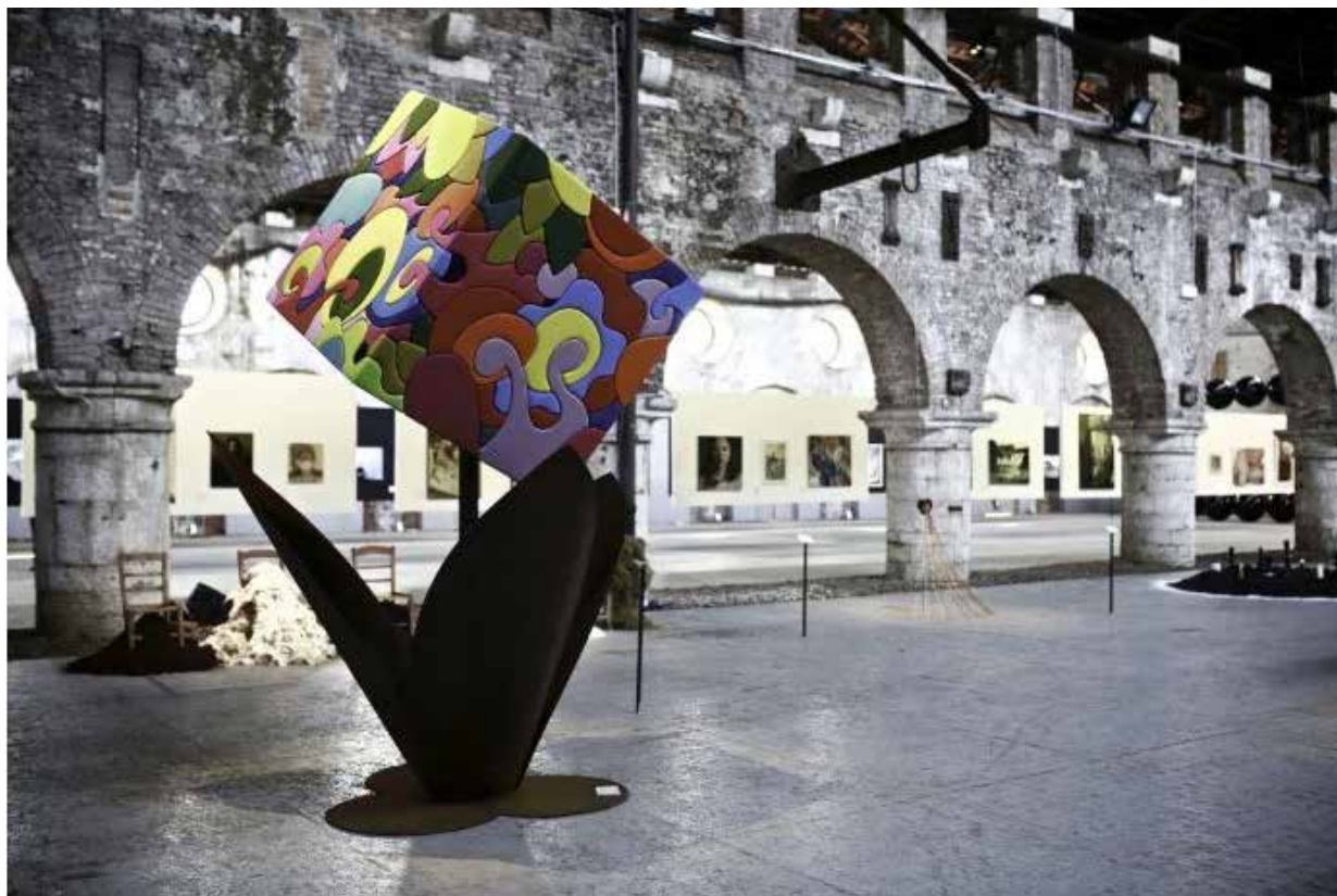
Arte Laguna Prize